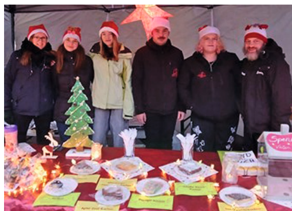
Stand auf dem Weihnachtsmarkt in Lucka

Viele Jugendliche in Lucka stehen vor demselben Problem: Außerhalb des Vereinslebens gibt es nur begrenzte Freizeitmöglichkeiten. Angebote für Kinder sind reichlich vorhanden, jedoch sind diese nicht wirklich für uns gemacht. Ab einem gewissen Alter haben wir andere Interessen. Wir möchten uns mit unseren Freunden im öffentlichen Raum finden, treffen, abgrenzen und uns selbst verwirklichen. Genau hier setzen wir an! Gemeinsam mit der Stadt Lucka und den Sozialarbeitenden der Jugendarbeit RoMeLu möchten wir neue Projekte ins Leben rufen, die jungen Menschen echte Perspektiven bieten.