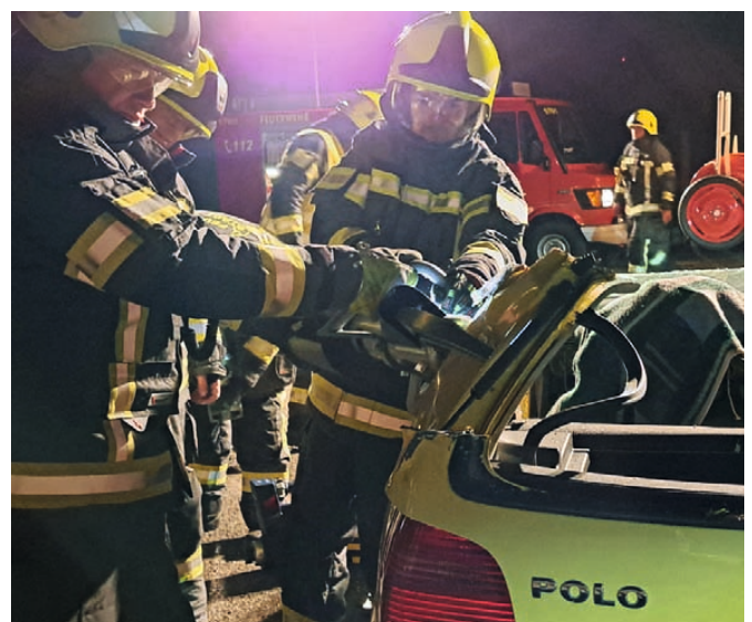
Kameradinnen und Kameraden bei der wöchentlichen Ausbildung mit hydraulischen Rettungsgeräten